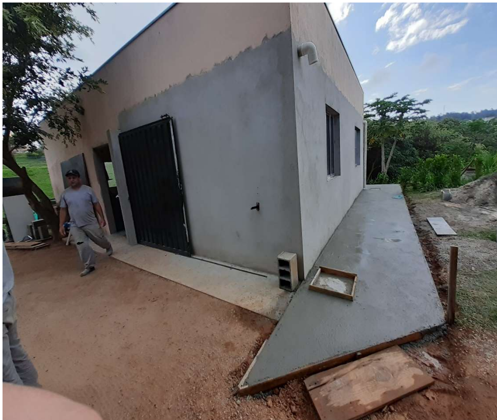
Execução das calçadas laterais