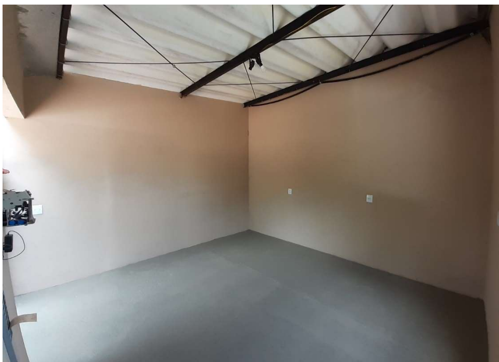
Espaço a ser utilizado pela equipe de jardinagem após acabamento

O primeiro local a ser finalizado foi o espaço destinado para guarda de ferramentas da equipe de jardinagem, que recebeu um vão para acesso de 1,60 metros com intuito de servir como garagem para o mini trator utilizado pela empresa.