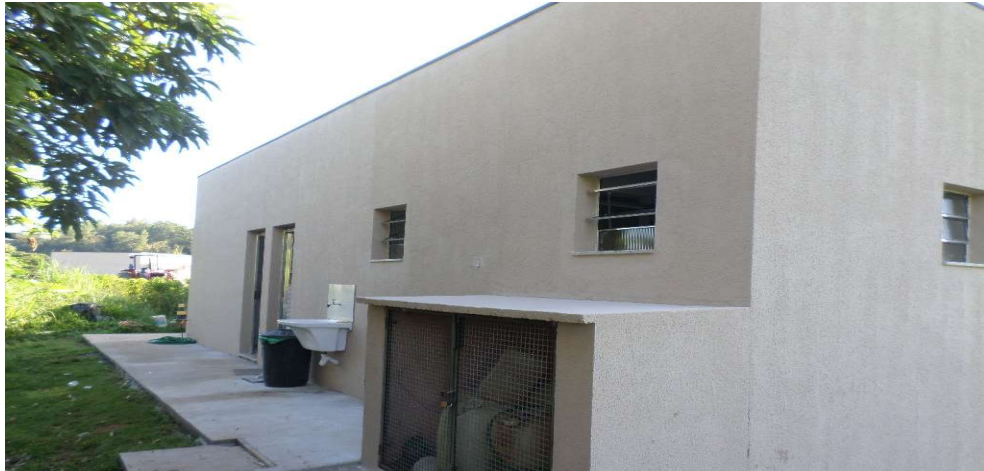
Face lateral do prédio

Associação dos Moradores do Villaggio Paradiso Rodovia Romildo Prado Km 10 - Tapera Grande Itatiba/ SP - CEP: 13.255-751 Fone: (11) 4534-2208 E-mail: contato@villaggioparadiso.org.br