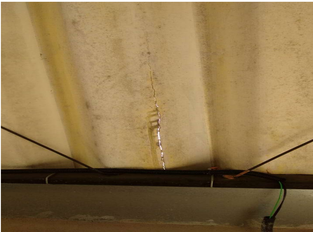
Detalhe de uma das trincas existentes no telhado