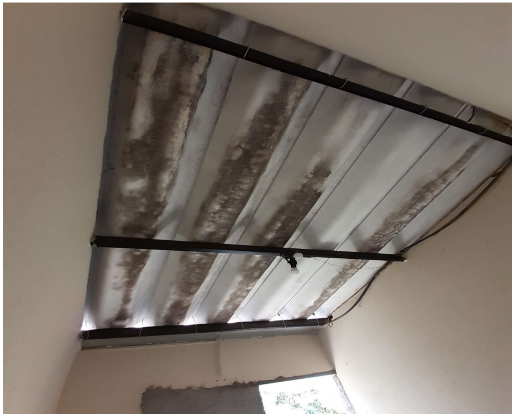
Face interna do telhado, com grande parte de mofo