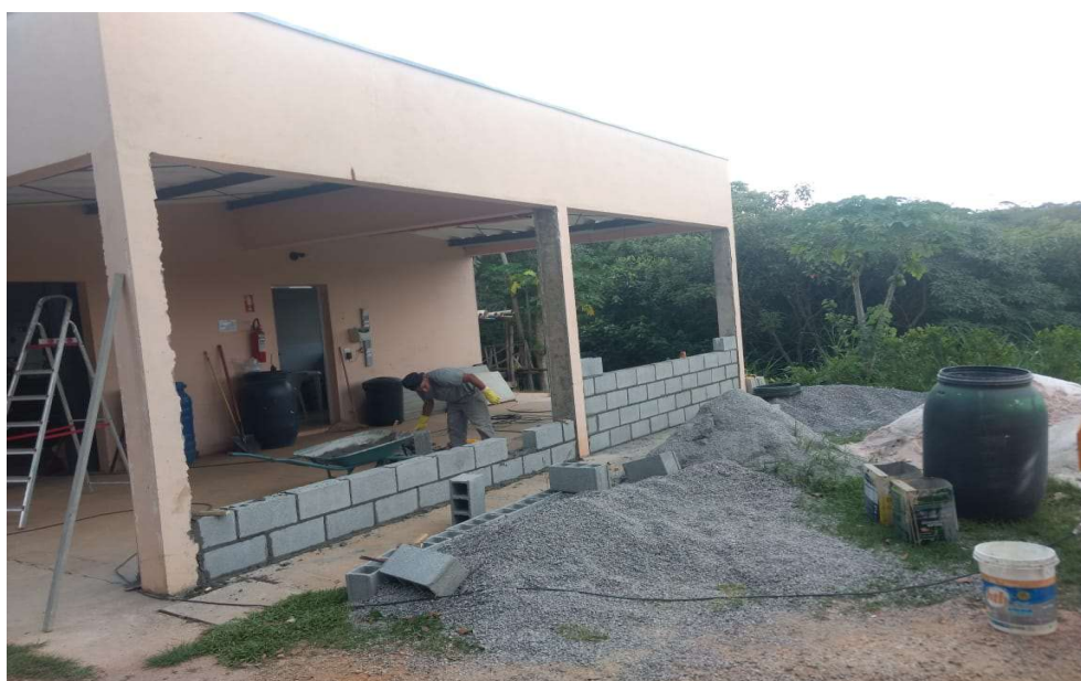
Fechamento das paredes externas

A fim de atender a logística do local, sem atrapalhar as equipes que utilizam o prédio, as obras de adequação foram iniciadas pela alvenaria de vedação, nova cozinha e área para guarda-volumes da equipe de jardinagem. Durante o fechamento destes locais, foi observado que seria necessário realizar a impermeabilização e checagem do sistema de drenagem do telhado tendo em vista que, em períodos de muita chuva, diversos pontos com goteiras estavam aparecendo.