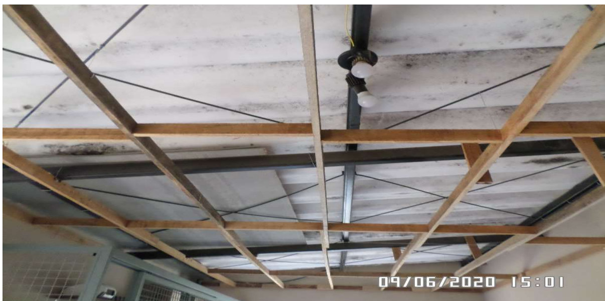
Execução da estrutura de sustentação

Associação dos Moradores do Villaggio Paradiso Rodovia Romildo Prado Km 10 - Tapera Grande Itatiba/ SP - CEP: 13.255-751 Fone: (11) 4534-2208 E-mail: contato@villaggioparadiso.org.br