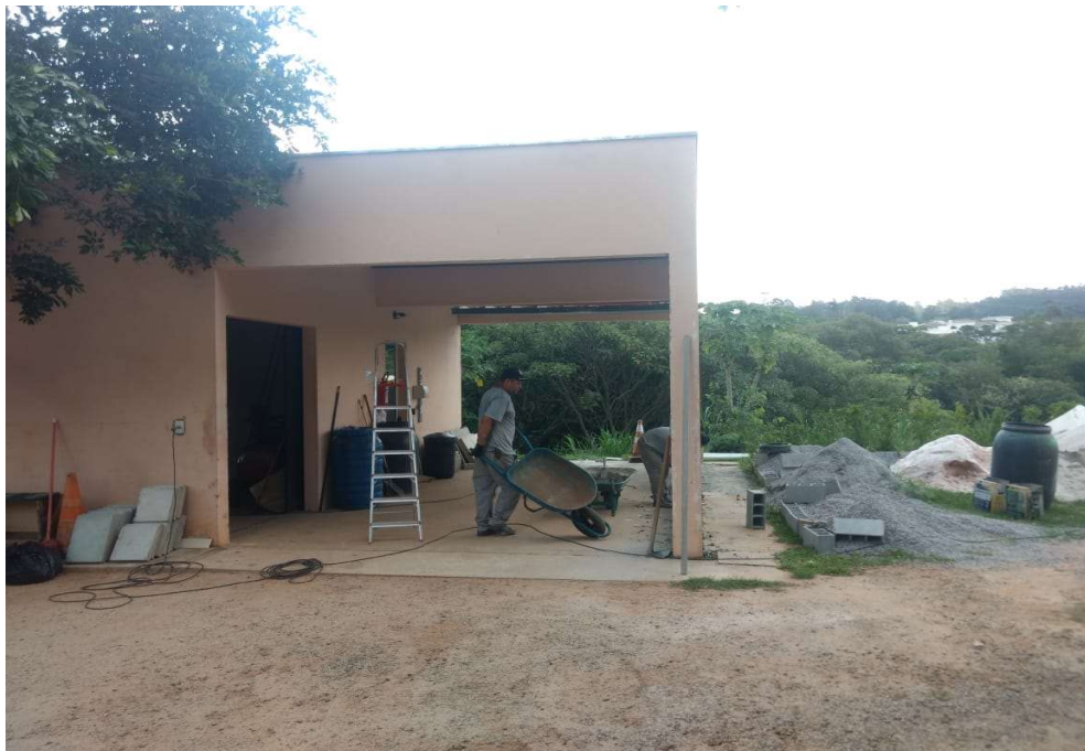
Antigo espaço para abrigo de veículos