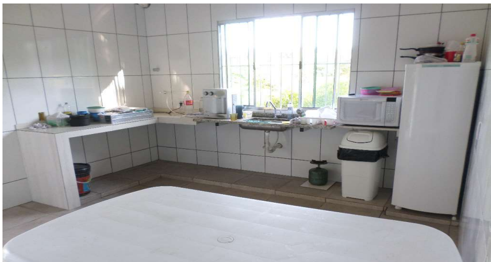
Cozinha após readequação