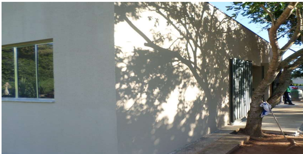
Fundos do prédio