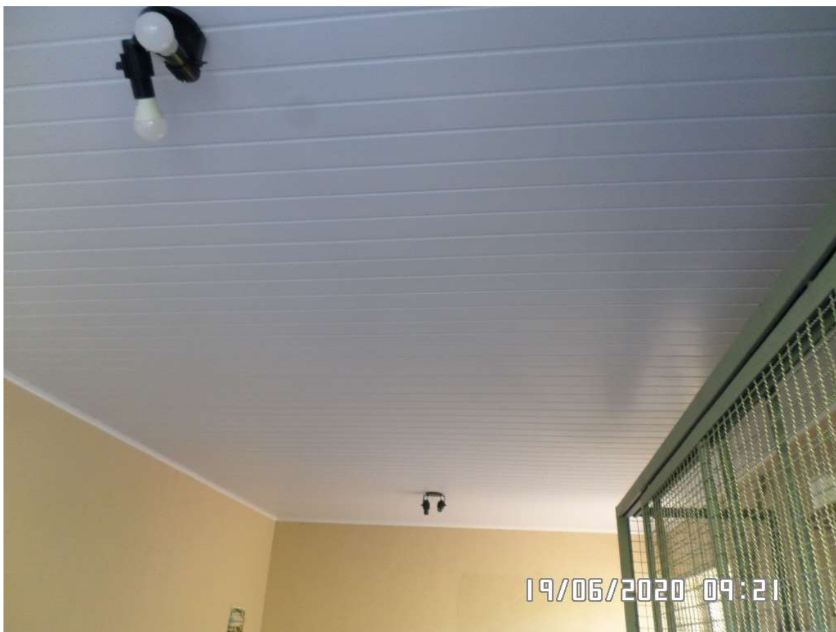
Fechamento das áreas internas com forro