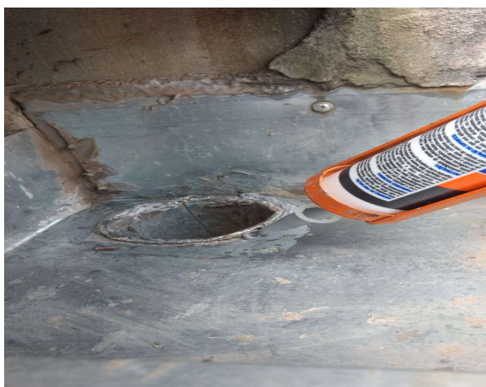
Vedação de condutores com poliuretano (PU)