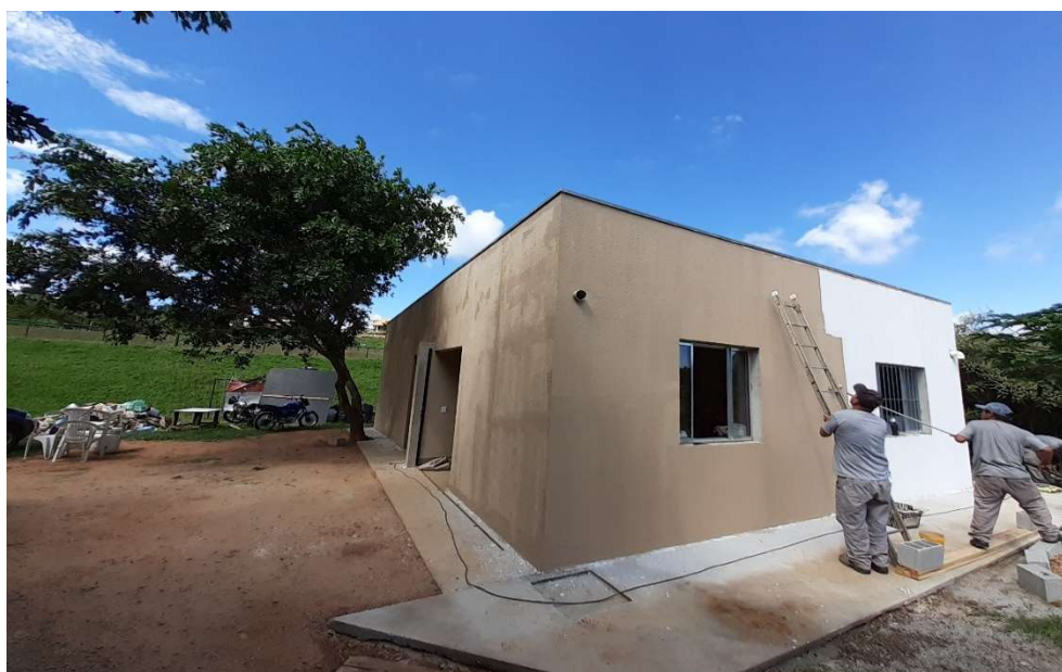
Aplicação de pintura em todo perímetro externo

Após a realização da primeira demão de pintura externa, houve um grande período de chuvas, onde os colaboradores ficaram focados em realizar atividades internas, a saber: realização do emboço da cozinha, reboco das áreas sanitárias, instalação das peças sanitárias, construção de bancada para cozinha, execução do revestimento da cozinha, banheiros e vestiário, organização dos materiais do “quarto da manutenção”, instalação do sistema elétrico, pintura interna, dentre outros.