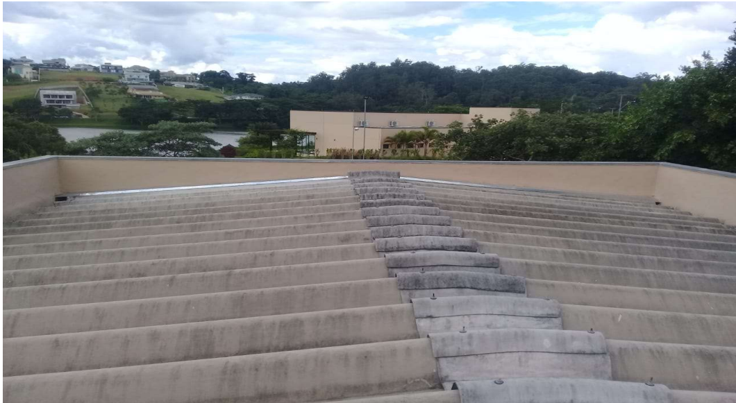
Vista do telhado

Associação dos Moradores do Villaggio Paradiso Rodovia Romildo Prado Km 10 - Tapera Grande Itatiba/ SP - CEP: 13.255-751 Fone: (11) 4534-2208 E-mail: contato@villaggioparadiso.org.br