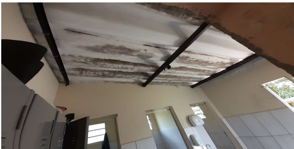
Face interna do teto do prédio de manutenção antes do fechamento