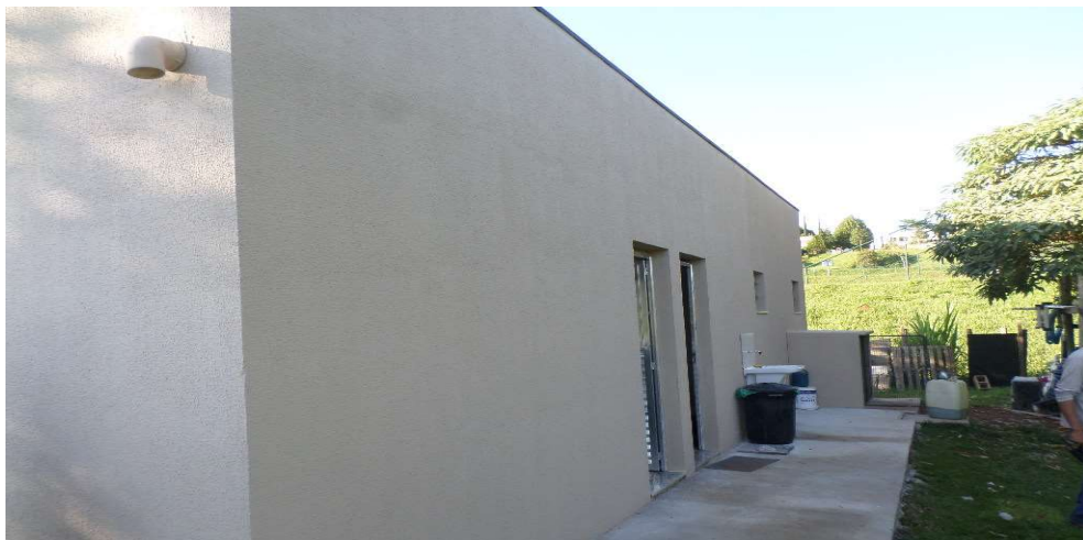
Face lateral do prédio