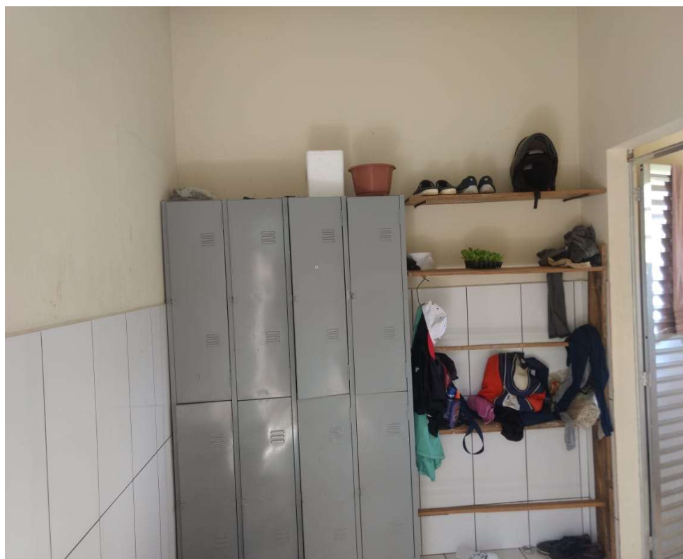
Antigo local para guarda objetos