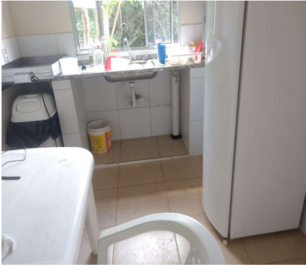
Antigo espaço destinado a refeições

Associação dos Moradores do Villaggio Paradiso Rodovia Romildo Prado Km 10 - Tapera Grande Itatiba/ SP - CEP: 13.255-751 Fone: (11) 4534-2208 E-mail: contato@villaggioparadiso.org.br