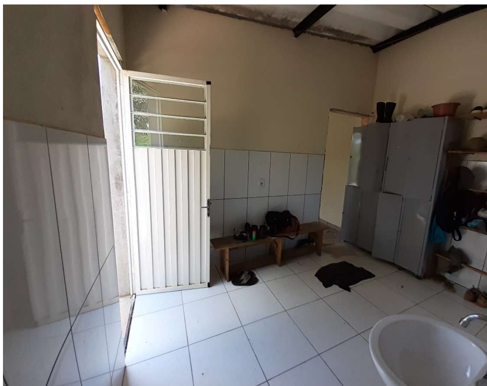
Vestiário, banheiros e chuveiro

Associação dos Moradores do Villaggio Paradiso Rodovia Romildo Prado Km 10 - Tapera Grande Itatiba/ SP - CEP: 13.255-751 Fone: (11) 4534-2208 E-mail: contato@villaggioparadiso.org.br