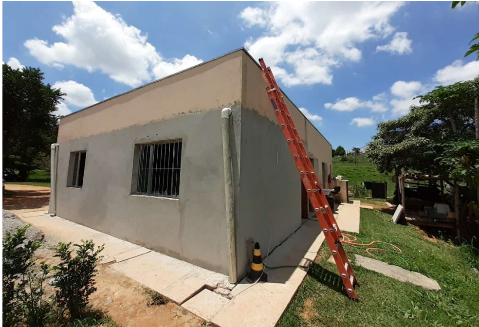
Fechamento das novas áreas, cozinha e guarda-volumes da jardinagem

Associação dos Moradores do Villaggio Paradiso Rodovia Romildo Prado Km 10 - Tapera Grande Itatiba/ SP - CEP: 13.255-751 Fone: (11) 4534-2208 E-mail: contato@villaggioparadiso.org.br