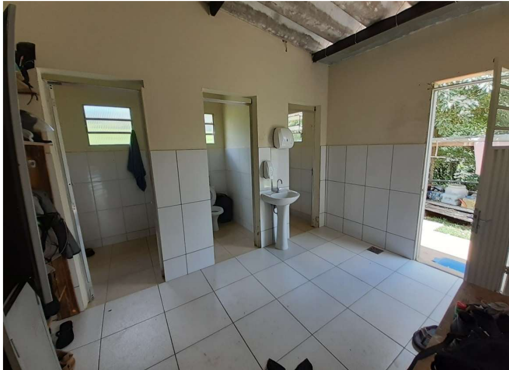
Antiga área dos sanitários e chuveiro. Da esquerda para direita: mictório, banheiro e chuveiro

Associação dos Moradores do Villaggio Paradiso Rodovia Romildo Prado Km 10 - Tapera Grande Itatiba/ SP - CEP: 13.255-751 Fone: (11) 4534-2208 E-mail: contato@villaggioparadiso.org.br