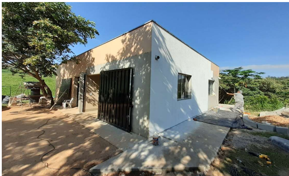
Aplicação de massa acrílica e grafiato

Associação dos Moradores do Villaggio Paradiso Rodovia Romildo Prado Km 10 - Tapera Grande Itatiba/ SP - CEP: 13.255-751 Fone: (11) 4534-2208 E-mail: contato@villaggioparadiso.org.br