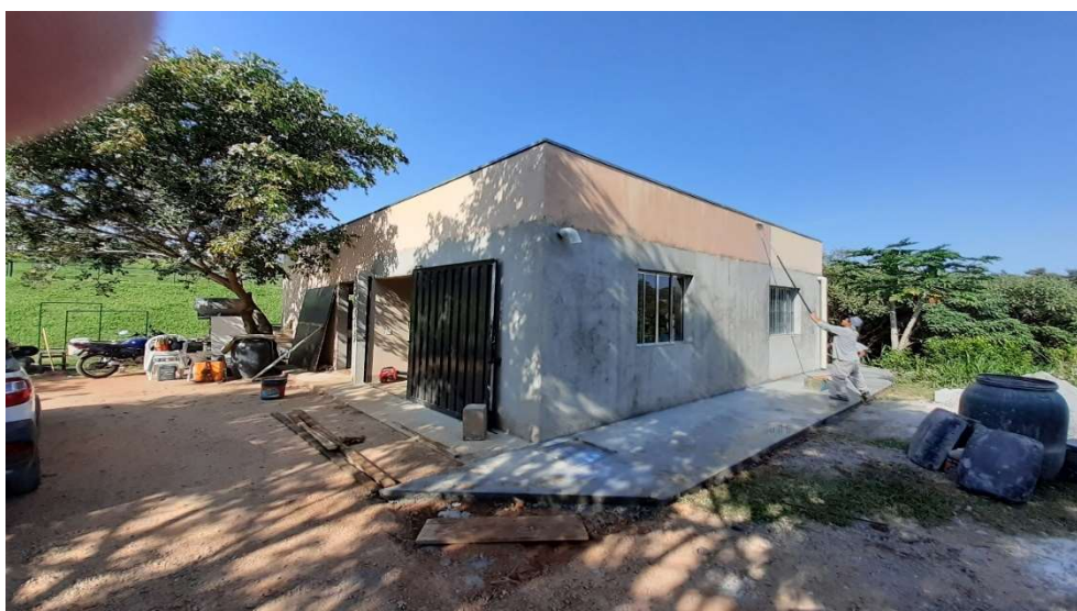
Passagem de fundo preparador e seladora em todo perímetro externo