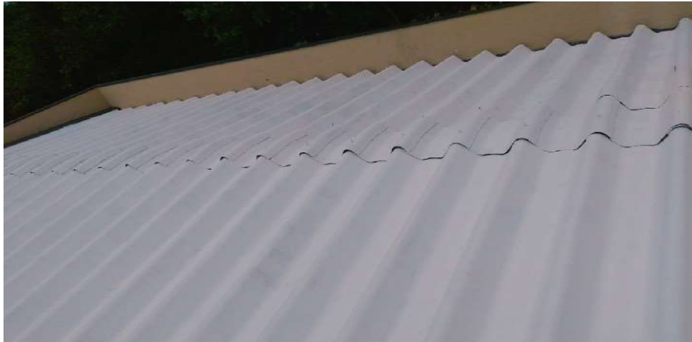
Pintura de telhado em geral após finalização

Associação dos Moradores do Villaggio Paradiso Rodovia Romildo Prado Km 10 - Tapera Grande Itatiba/ SP - CEP: 13.255-751 Fone: (11) 4534-2208 E-mail: contato@villaggioparadiso.org.br